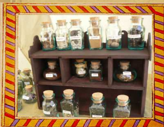
Comptoir des épices