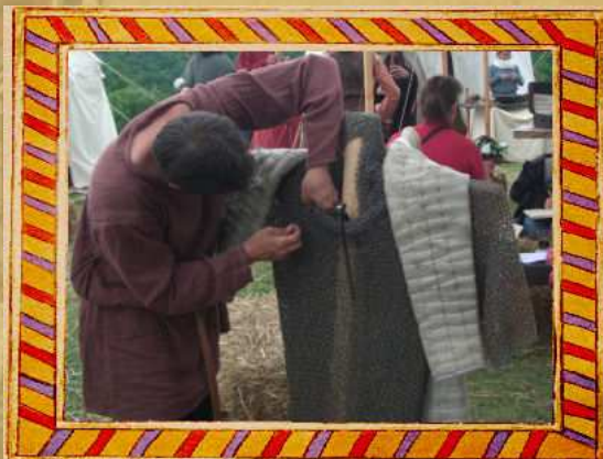
Haubergeonnerie (fabrication d'armures de mailles)