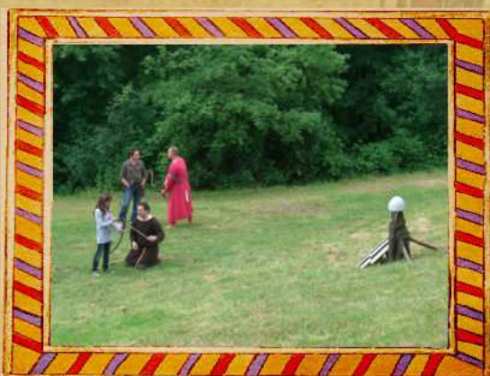
Tir à l'arc médiéval