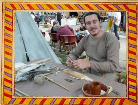
Fabrication de flèches