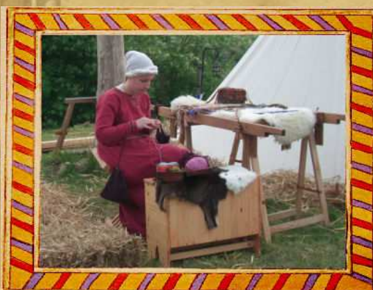
Tissage et broderies