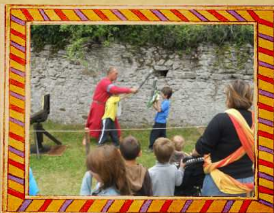
Les « petits chevaliers »