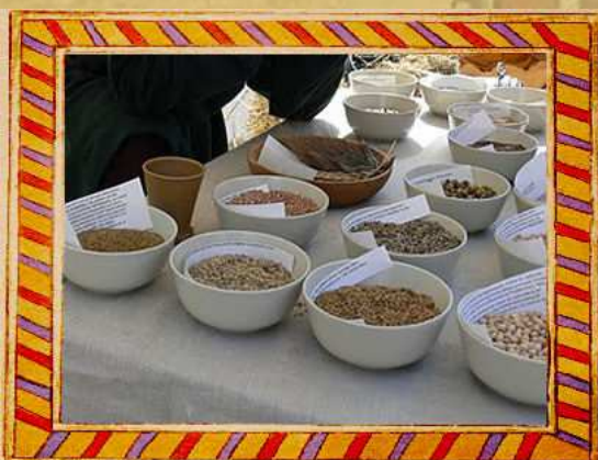
Comptoir de colporteur de semences