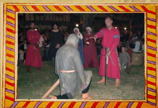
Adoubement au XIII ème siècle

Les animations sont à destination du public et se suivent comme un spectacle.