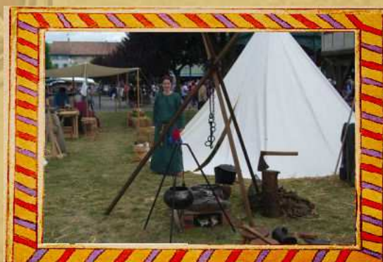
Vie de campement