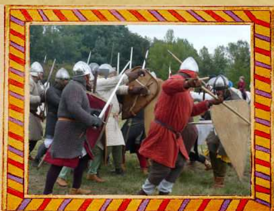
Arts martiaux historiques européens

Nous partageons et présentons les gestes, connaissances et savoir-faire de nos ancêtres médiévaux et répondons avec le plus grand des plaisirs aux questions du public.