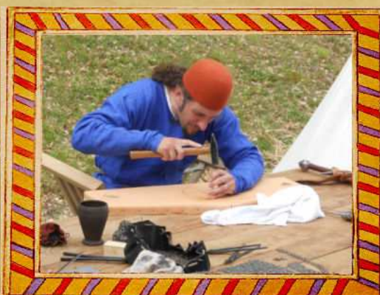
Bourrellerie (travail du cuir)