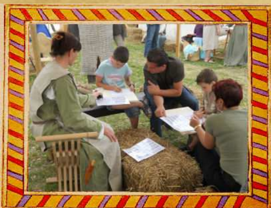
Atelier de calligraphie

Les ateliers sont participatifs. Le public est invité à s'asseoir et à participer activement, à apprendre et à s'amuser avec nous.