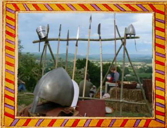
Equipped du guerrier